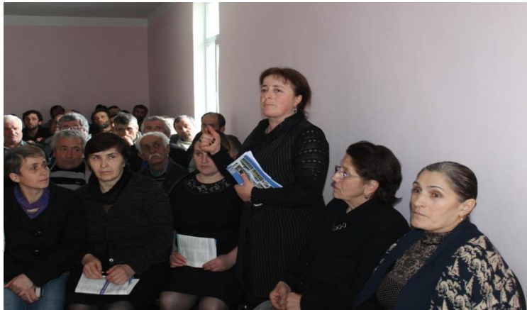
ქედის მუნიციპალიტეტი 2016 წლის „სოფლის მხარდაჭერის პროგრამა“