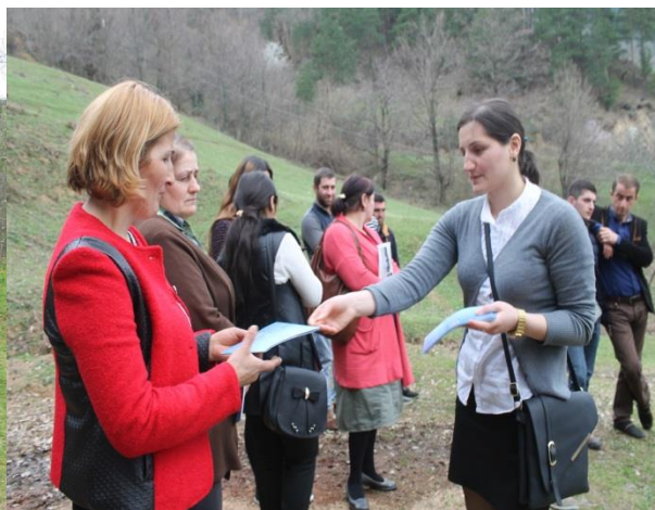
„ქალების ჩართულობა გადაწყვეტილებების მიღების პროცესში“